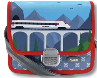
S6020.003 Fast Train