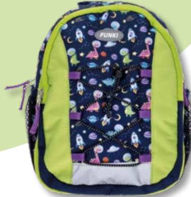
6022.021 Space Dinos