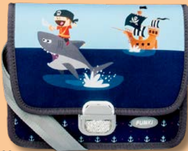
6020.022 Little Pirate