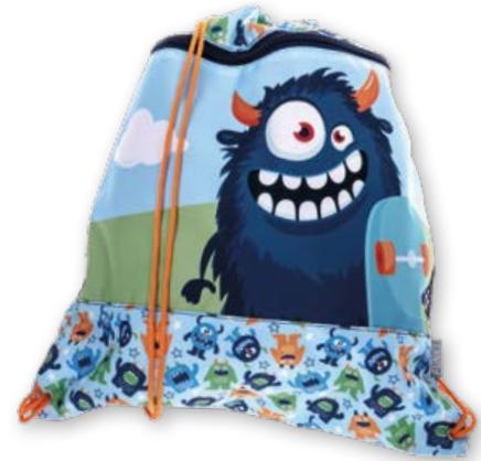
6030.041 Fluffy Monster