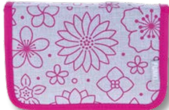
6012.007 Pink Flowers