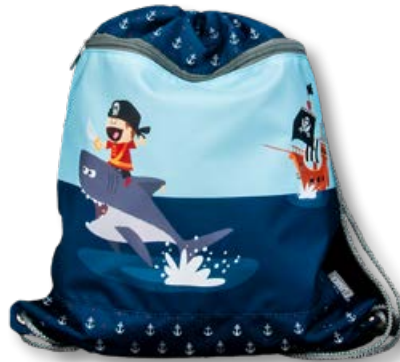
6030.022 Little Pirate