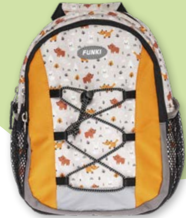
6022.023 Forest animals