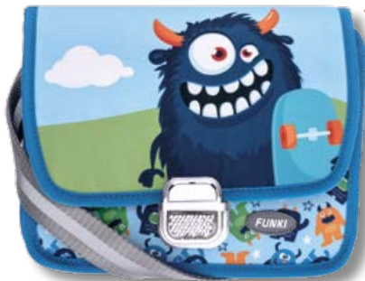
6020.041 Fluffy Monster