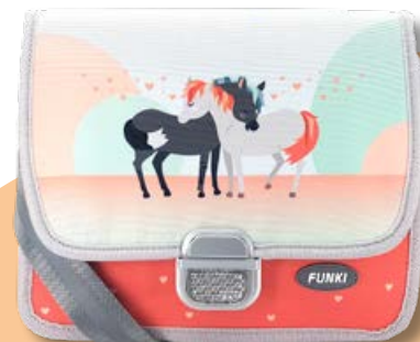
6020.036 Horses in Love