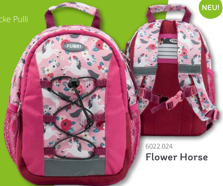
6022.024 Flower Horse