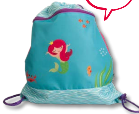
6030.020 Little Mermaid