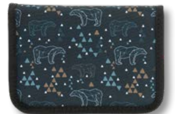
6012.004 Polar Bear