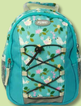
6022.002 Birds in Love