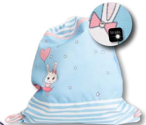
6030.015 Sweet Bunny