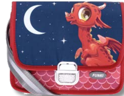
6020.040 Ruby Dragon