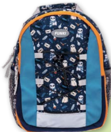
6022.019 Magic Owl