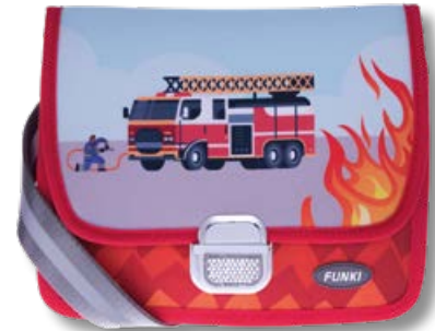
6020.034 Fire Alarm