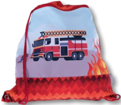
6030.034 Fire Alarm