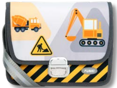
6020.027 Under Construction