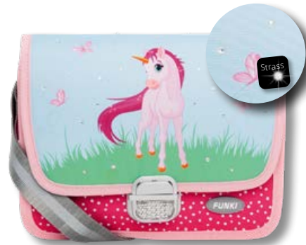
6020.026 Pink Unicorn