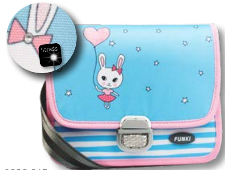
6020.015 Sweet Bunny