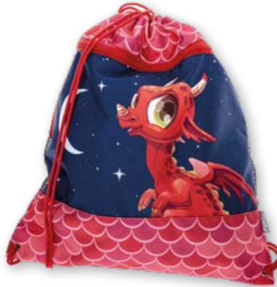
6030.040 Ruby Dragon