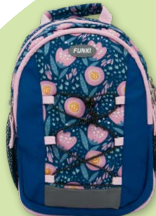
6022.018 Lovely Flowers