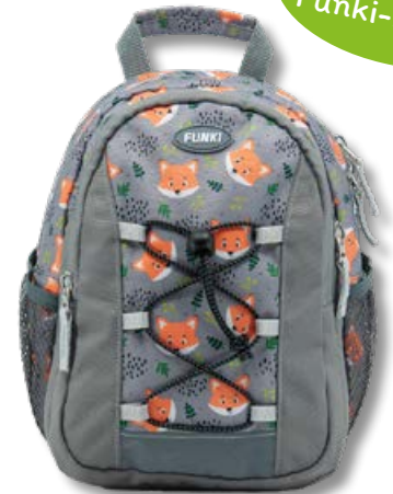
6022.009 Little Fox