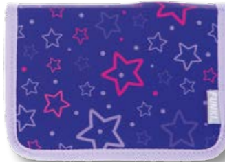
6012.008 Purple Stars