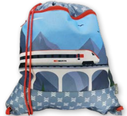
56030.003 Fast Train