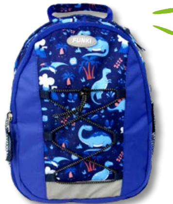
6022.005 Dino World