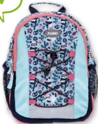
6022.020 Happy Panda